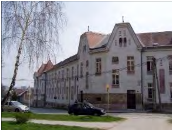
Obr. 15 Budova Strednej zdravotníckej školy