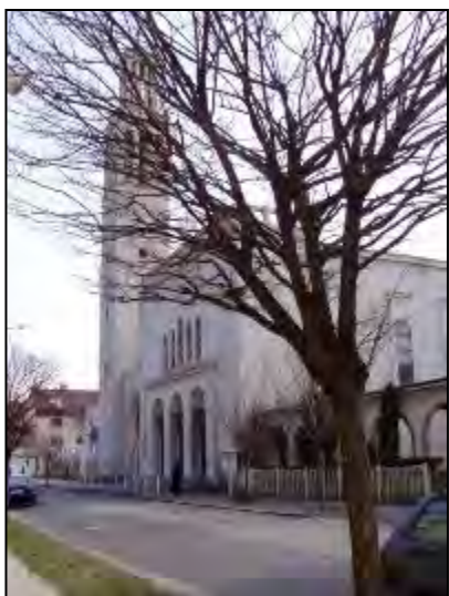
Obr. 13 Kostol Kráľovnej pokoja