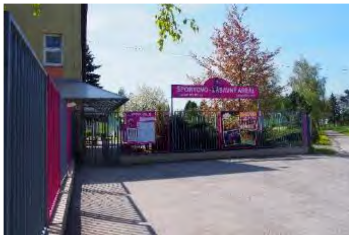
Obr. 56 Vstupná brána ŠZA

Budova areálu: v priestoroch budovy je k dispozícii bufet, detské hry, stolný futbal, tenis, mobilná knižnica a vonku letná terasa, na prvom poschodí sa pravidelne koná dopravná výchova pre deti spojená s premietaním po skončení dopravnej výchovy vedenej príslušníkmi polície. Budova sa dá prenajať k rôznym spoločenským podujatiam ako napríklad oslavy narodenín. Od roku 2016 si môžu návštevníci areálu zahrať v budove areálu billiard.