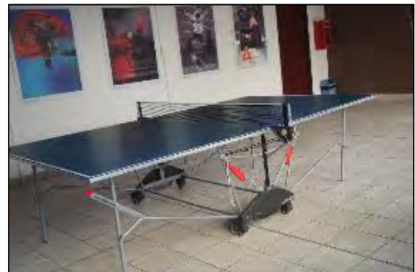
Obr. 68 a 69 Indoorové atrakcie – billiard a stolný tenis