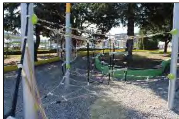
Obr. 5 Opičia lanová dráha ŠZA