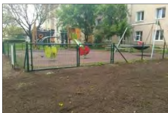
Obr. 38 Detské ihrisko Hombáľkovo

Všetky detské a športové ihriská s popisom a fotogalériou sú uvedené na webovej stránke www.kosicejuh.sk v časti Občan – Šport a voľný čas.