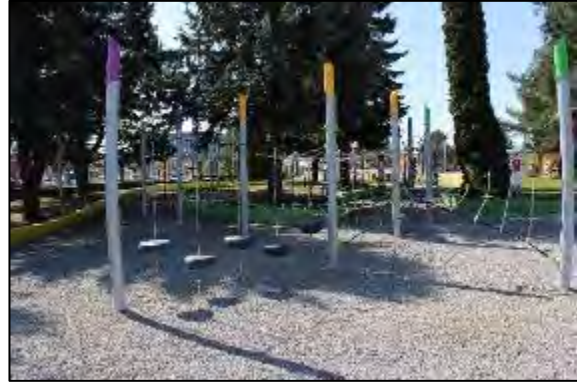
Obr. 60 Opičia lanová dráha