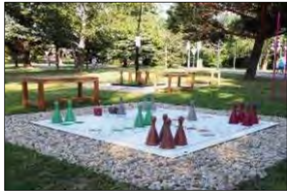
Obr. 62 Človeče nehnevaj sa