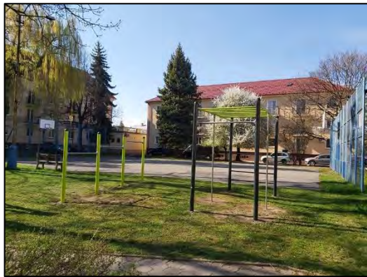
Obr. 6 Nové workoutové ihrisko Gaštanová