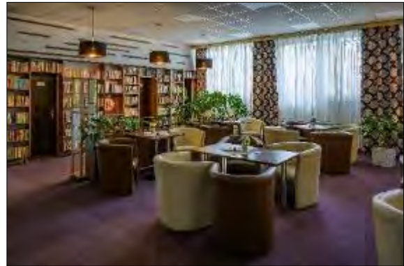
Obr. 3 Vstupný vestibul Jedálne pre dôchodcov