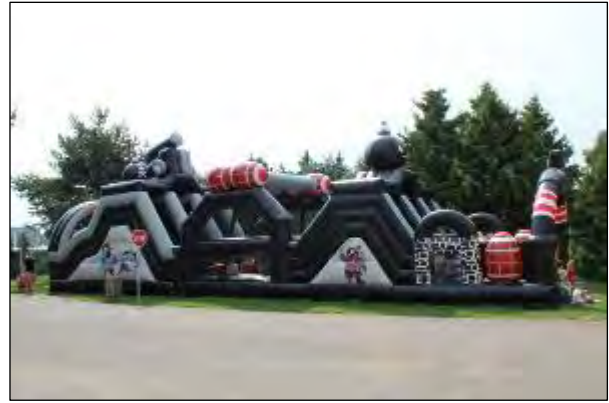
Obr. 65 Nafukovacia 18 m prekážková dráha