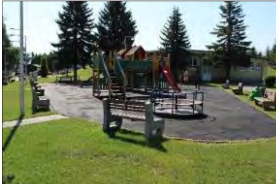
Obr. 43 Pôvodné detské ihrisko

Solutions Slovakia s.r.o. sa zmluvné strany dohodli od roku 2020 na zmene názvu areálu na #magentalife Športovo – zábavný areál.