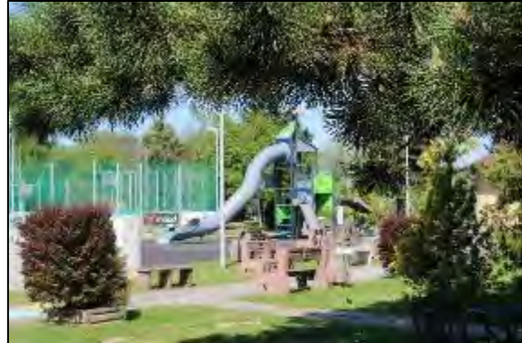
Obr. 44 Nová herná veža s tobogánom

Viacúčelové športové ihriská: v rokoch 2004 až 2006 boli vybudované tri viacúčelové ihriská s umelým trávnatým povrchom a umelým osvetlením s využitím na basketbal, volejbal, nohejbal, futbal či tenis, ihriská je možné využívať celoročne, sú oplotené a vybavené brámkami, basketbalovými košmi a k dispozícii je aj požičovňa športových náradí. V roku 2018 sme vymenili starý opotrebovaný umelý trávnik za nový.