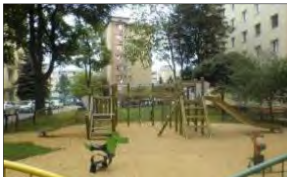
Obr. 34 Detské ihrisko Safari