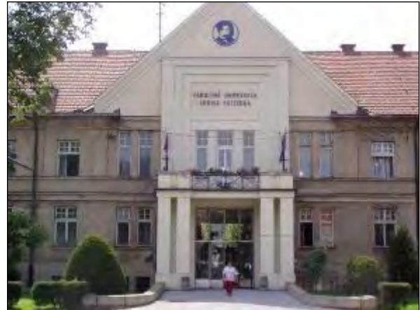
Obr. 16 Univerzitná nemocnica Louisa Pasteura

Francúzsky park je zvláštnosťou Univerzitnej nemocnice Louisa Pasteura na Rastislavovej ul. od jej založenia od r. 1924. Vyše 90 – ročná záhrada UNLP patrí k územiám s najvyšším stupňom ekologickej stability, je označovaná za pľúca Košíc a vytvára mikroklimu južnej časti mesta. Historický park UNLP Košice je posledný nemocničný udržiavaný starý francúzsky park na Slovensku.