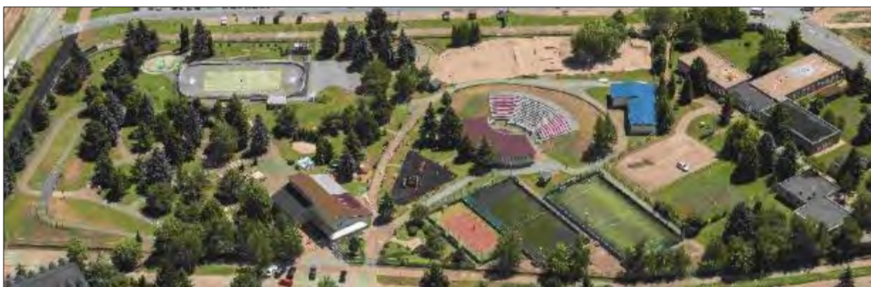
Obr. 42 areál ŠZA

Mestská časť Košice – Juh je vlastníkom a správcom Športovo - zábavného areálu na Alejovej 2 v Košiciach o rozlohe 22 546 m 2 , ktorý denne navštívi veľa detí, športovcov, občanov a návštevníkov mesta Košice. Areál je prispôsobený všetkým vekovým kategóriám – starší ľudia využívajú možnosť zahrať si stolný tenis, šípky, extérierové šachy, petanque, biliard. Stredná generácia využíva multifunkčné ihriská, skatepark, mobilnú ľadovú plochu, cvičenia TRX, externú posilňovňu. Pre najmladšiu generáciu je tu detské ihrisko, pieskovisko, preliezačky, hojdačky, trampolína, skákacia vranka. Pre všetky vekové kategórie je zaujímavý Adventure golf a altánok, ktoré umožňujú relax pre celé rodiny. Maskot areálu vranka „Alejko“ sa stala milou atrakciou na organizovaných podujatiach. V roku 2017 bola ľadová plocha kompletne zrekonštruovaná v hodnote takmer 95 tis. eur a aj vďaka tomu je možné povrch priestoru ľadovej plochy počas letných mesiacov využívať na ďalšie druhy športov ako napr. tenis, speedminton, či hokejbal. V roku 2019 sme sa stali nositeľmi slovenského rekordu za najviac športovísk a aktivít na jednom mieste. Športovo – zábavný areál má ako jediný na Slovensku 45 možností športovania, k dispozícii je ešte 13 ďalších podporných aktivít. V roku 2020 sa doplnila nová detská atrakcie v podobe 6 metrovej veže s veľkým tobogánom a šmýkalkou.