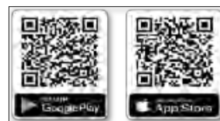
Obr. 8 Bezplatná mobilná aplikácia Košice - Juh