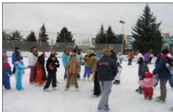
Obr. 48 Nonstop 24 hodinové korčuľovanie