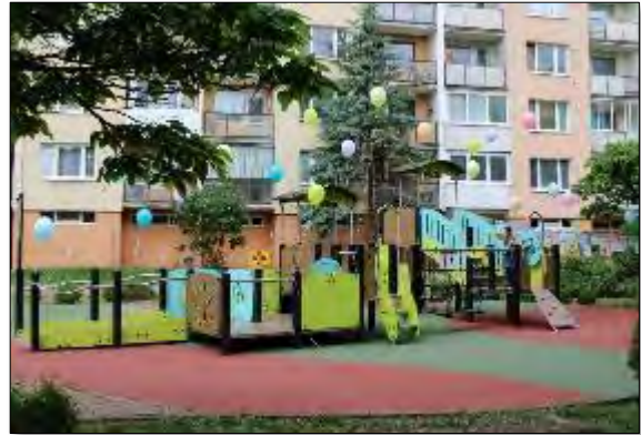
Obr. 7 Nové integrované detské ihrisko Modroočko na Ludmanskej