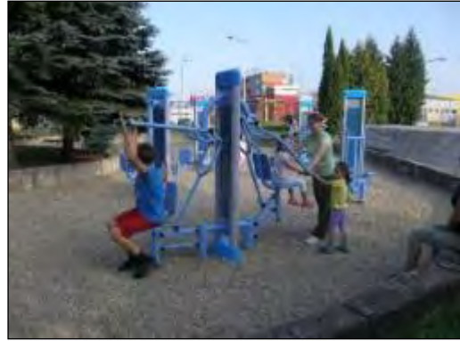
Obr. 58 Exteriérová posilňovňa