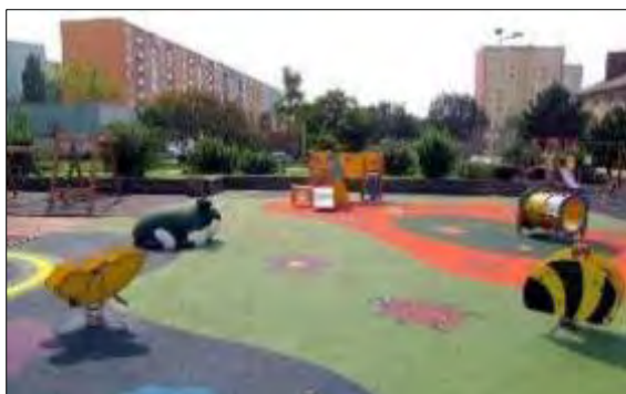
Obr. 33 Detské ihrisko Lienka