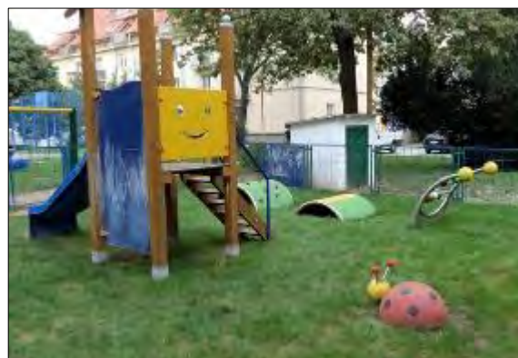
Obr. 35 Detské ihrisko Gaštanová