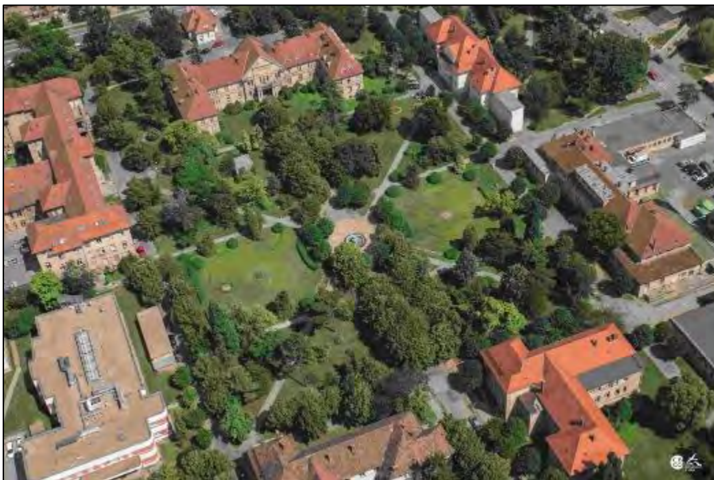
Obr. 17 Univerzitná nemocnica Louisa Pasteura

Francúzsky park je zvláštnosťou Univerzitnej nemocnice Louisa Pasteura na Rastislavovej ul. od jej založenia od r. 1924. Vyše 90 – ročná záhrada UNLP patrí k územiám s najvyšším stupňom ekologickej stability, je označovaná za pľúca Košíc a vytvára mikroklimu južnej časti mesta. Historický park UNLP Košice je posledný nemocničný udržiavaný starý francúzsky park na Slovensku.