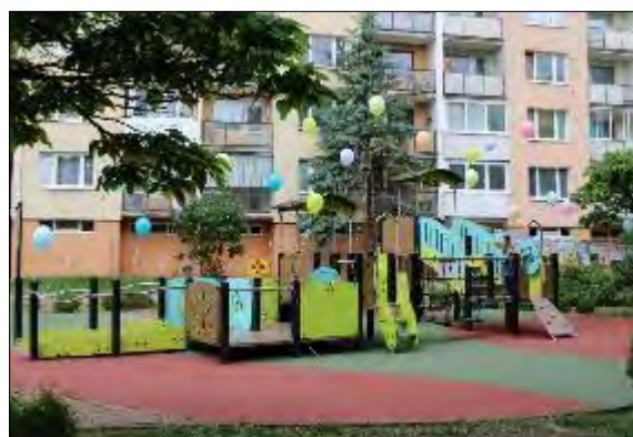
Obr. 36 Detské ihrisko Ludmanská