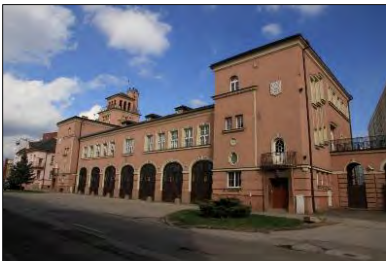
Obr. 14 Budova Okresného riaditeľstva hasičského a záchranného zboru