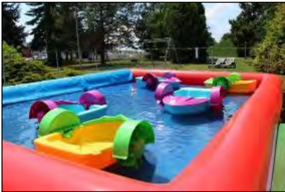
Obr. 59 Člnkovanie