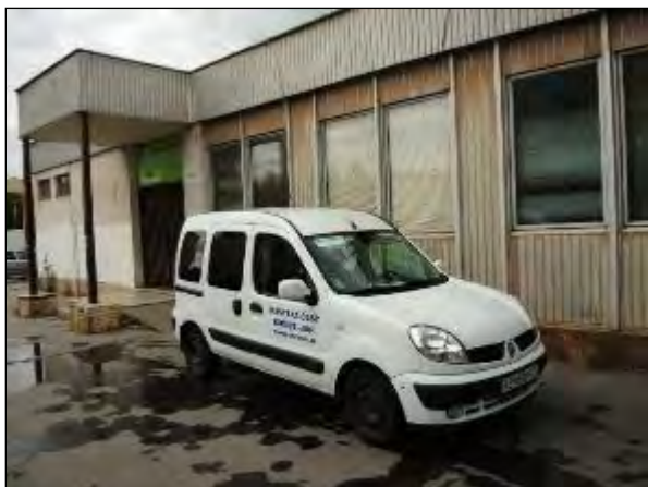
Obr. 21 Jedáleň pre dôchodcov, Vojvodská 5 pôvodný stav