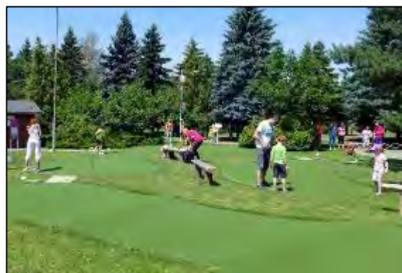
Obr. 54 a 55 Adventure golf

Budova areálu: v priestoroch budovy je k dispozícii bufet, detské hry, stolný futbal, tenis, mobilná knižnica a vonku letná terasa, na prvom poschodí sa pravidelne koná dopravná výchova pre deti spojená s premietaním po skončení dopravnej výchovy vedenej príslušníkmi polície. Budova sa dá prenajať k rôznym spoločenským podujatiam ako napríklad oslavy narodenín. Od roku 2016 si môžu návštevníci areálu zahrať v budove areálu billiard.