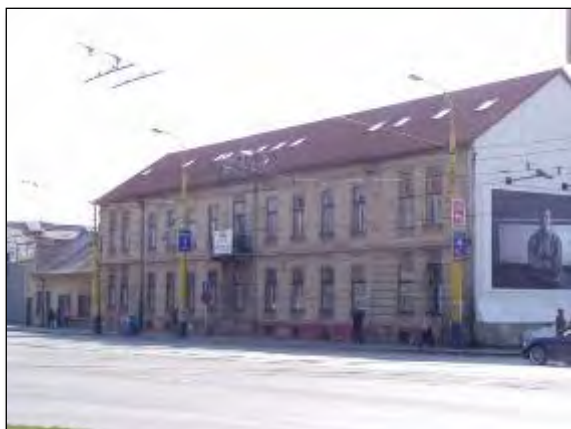
Obr. 11 Siposova továreň