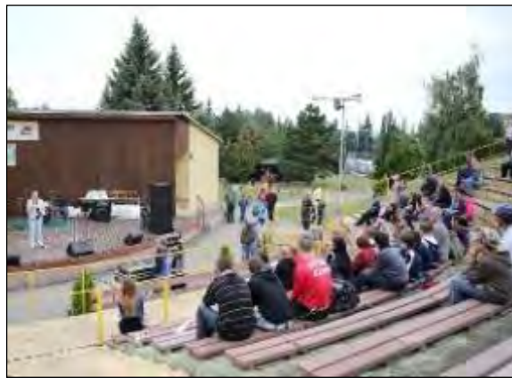
Obr. 51 Deň otvorených dverí – amfiteáter

Skate park: výstavba skate parku pre všetkých milovníkov tohto športu bola realizovaná v rokoch 2008 až 2009 a hneď od uvedenia do prevádzky si našiel svojich stálych športových nadšencov a návštevníkov.