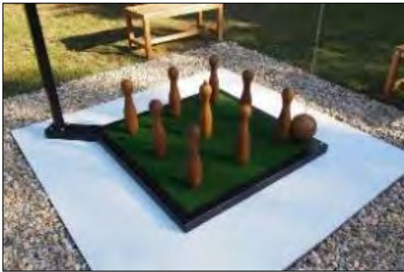
Obr. 61 Ruské kolky