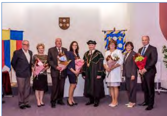
Obr. 19 Udeľovanie verejných ocenení

Kolektív fyzioterapie Kliniky úrazovej chirurgie UNLP Košice - za osobitný prínos v boji proti následkom ochorenia Covid - 19.