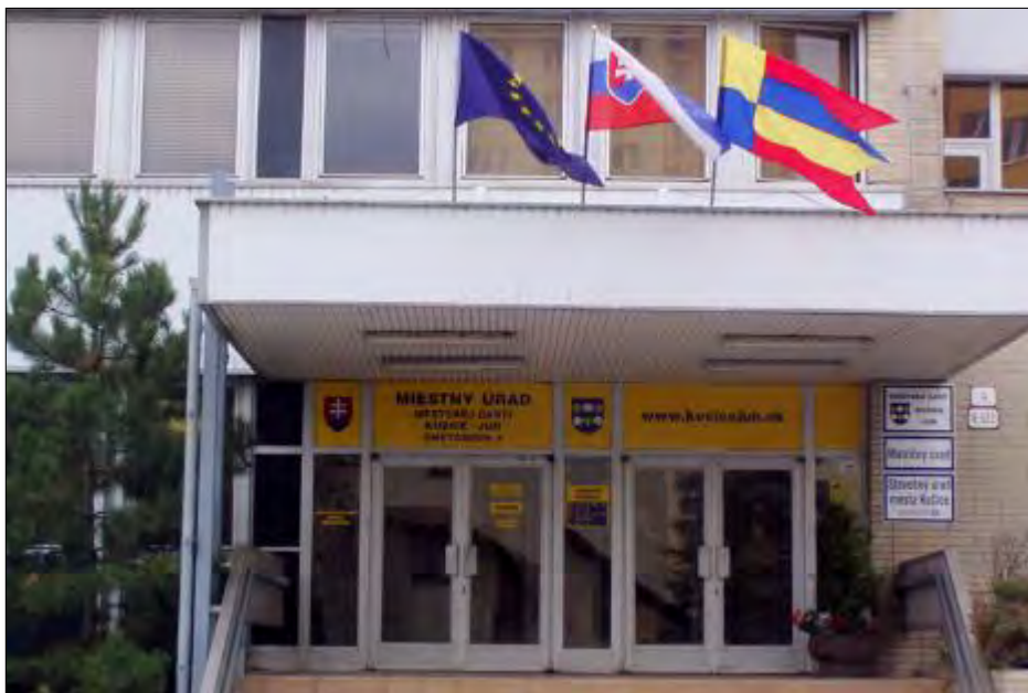
Obr. 9 Vstup do budovy MÚ MČ Košice – Juh, Smetanova 4

Obecný úrad: Miestny úrad MČ Košice - Juh, Smetanova 4, 040 79 Košice