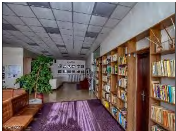
Obr. 25 až 28 Interiér Jedálne pre dôchodcov, Vojvodská 5 po úpravách v roku 2019 a 2020

MČ Košice - Juh v rámci iných sociálnych činností monitoruje nelegálne osady, poskytuje materiálnu pomoc občanom a rodinám v hmotnej a sociálnej núdzi formou poskytovania potravín.