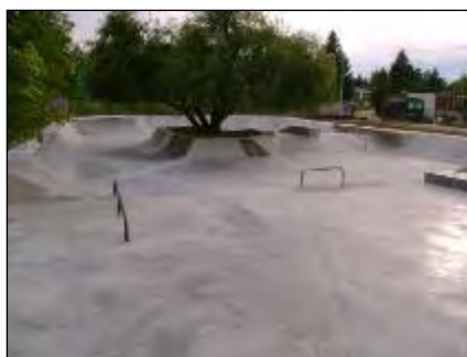
Obr. 52 a 53 Skate park

Golfové ihrisko: dňa 7. októbra 2013 sa slávnostne otvorila a začala prevádzka deväť jamkového Adventure golfu. Je to golf, ktorý sa hrá podľa pravidiel riadneho golfu, čím je atraktívny nielen pre amatérskych hráčov, ale aj pre golfistov hrajúcich na veľkých greenoch, na patovanie a to už v období, keď sa ešte golf nedá hrať na trávnatých ihriskách. Sedem jamiek je postavených na 2 páry a dve na tri. Aj keď sa zdá, že dráhy sú pomerne jednoduché, opak je pravdou, treba to len vyskúšať. Okolité prostredie golfových ihrísk je upravené tak, aby poskytovalo pre hráčov maximálnu možnosť na relax a športové vyžitie.