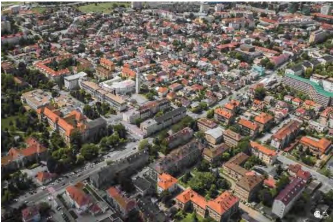
Obr. 10 Pohľad na MČ Košice – Juh z vtáčej perspektívy