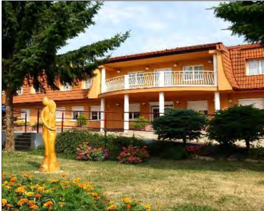
Obr. 39 Budova Spoločensko-relaxačného centra, Milosrdenstva 4

Denné centrum seniorov tak plní požiadavky občanov v oblasti záujmovej, kultúrnej a športovej činnosti, v snahe udržiavania fyzickej a psychickej aktivity občanov, ktorí sú poberateľmi starobného dôchodku alebo občanov s nepriaznivým zdravotným stavom.