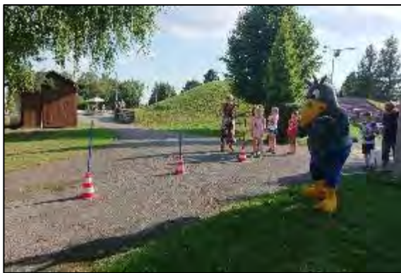
Obr. 4 popoludnie s maskotom Alejkom na ŠZA