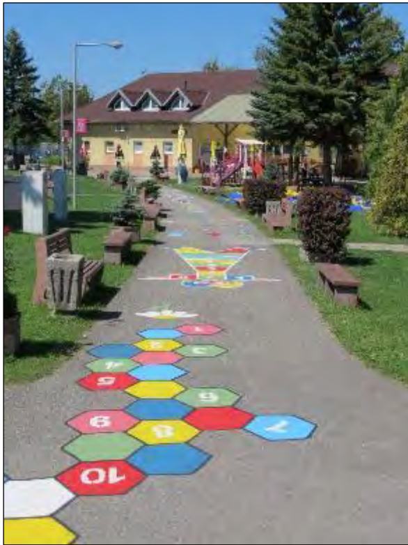
Obr. 66 Interaktívny skákací chodník