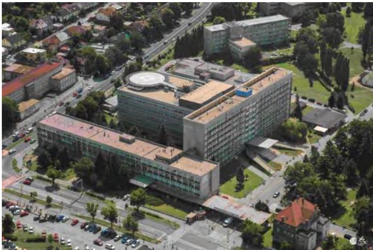
Obr. 20 Univerzitná nemocnica L. Pasteura

Zdravotnú starostlivosť v MČ Košice – Juh poskytuje: Poliklinika Juh Košice, Univerzitná nemocnica L. Pasteura, štátni a súkromní lekári.