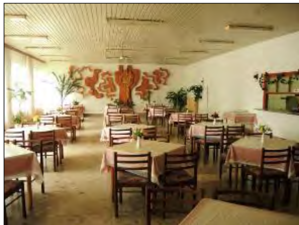
Obr. 22 Interiér Jedálne pre Dôchodcov pôvodný stav