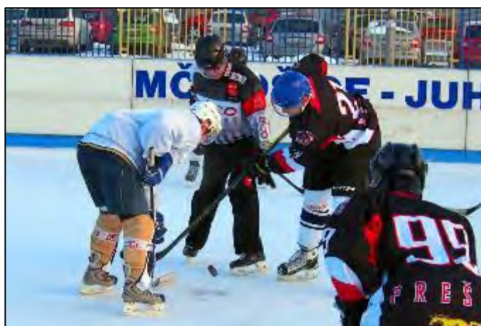
Obr. 49 Hokejový zápas