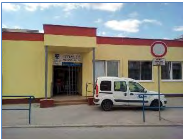
Obr. 23 a 24 Jedáleň pre dôchodcov, Vojvodská 5 po rekonštrukcii v roku 2016