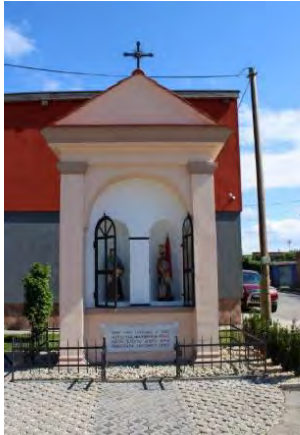
Obr. 18 Božia muka svätého Floriána a svätého Jána Nepomuckého

Božia muka svätého Floriána a svätého Jána Nepomuckého - pre tento typ sakrálnej stavby sa používa termín „božia muka“, od kaplnky sa líši tým, že nemá vnútorný priestor, do ktorého vojde človek. Bola postavená v roku 1826 ako odkaz na kresťanskú tradíciu odpúšťania dlhov a trestov za spáchané hriechy. Je vymurovaná z tehál a kameňa v klasicistickom štýle. V oblúkovite ukončenom výklenku sú vyhlbené dve hlbšie niky. V nich sa pôvodne nachádzali drevené sochy sv. Floriána a sv. Jána Nepomuckého. Svätci vytvárali klasickú zostavu ochrancov proti vode a ohňu.