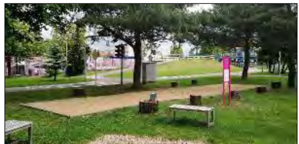
Obr. 67 Petangové ihrisko