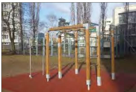
Obr. 37 Fitnes ihrisko Paláriková