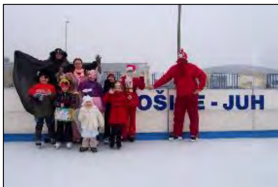
Obr. 47 Mikuláš na ľade

Ľadová plocha: v decembri 2006 bola sprístupnená verejnosti umelá ľadová plocha o rozmeroch 20x40 m s umelým chladením a osvetlením, je vybavená profesionálnymi mantinelmi, hokejovými brámkami, ochrannými sieťami a striedačkami, plochu je možné využívať od novembra do marca za predpokladu denných teplôt do +12 st. Celzia, využíva sa na verejné korčuľovanie, amatérsky hokej, tréningovú činnosť hokejových tried ako aj na športovo-zábavné akcie pre obyvateľov mesta Košice. V roku 2014 sme pre najmenších korčuliarov zabezpečili pomôcku na ľad – 2 pinquinov a 2 pandy, ktoré sú nápomocné deťom pri prvých krokoch na ľade. V lete je možné priestor ľadovej plochy využiť aj pre iné športové aktivity ako tenis, speedminton, streetbal, florbal alebo amatérsky hokejbal. V roku 2016 sa ľadová plocha stala po prvýkrát dejiskom Nonstop 24 hodinového korčuľovania, ktoré je spojené so zápisom do knihy Slovenských rekordov. Získali sme 2 slovenské rekordy v počte korčuliarov na ľade počas 24 hodín (1610 korčuliarov) a v počte nakorčuľovaných kilometrov počas 24 hodín (1298 km). V decembri 2016 sme vlastný rekord v počte korčuliarov na ľade prekonal (6043 km). Tento rekord je zapísaný aj v americkej knihe rekordov Record Setter. V roku 2019 sme rekord v počte nakorčuľovaných kilometrov prekonal a jeho výsledná hodnota je 8 986 km. Na úpravu ľadovej plochy sme vďaka finančným prostriedkom z mesta Košice mohli zakúpiť rolbu, vďaka ktorej je kvalita ľadu omnoho vyššia.