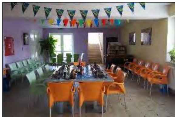
Obr. 63 a 64 Organizovanie detských osláv na ŠZA