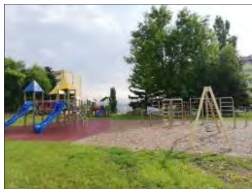
Obr. 31 Detské ihrisko Železníček-Nezbedníček Obr. 32 Detské ihrisko Lomonosovova