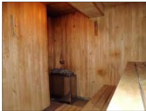
Obr. 40 a 41 Relaxačný bazén s vírivkami a sauna