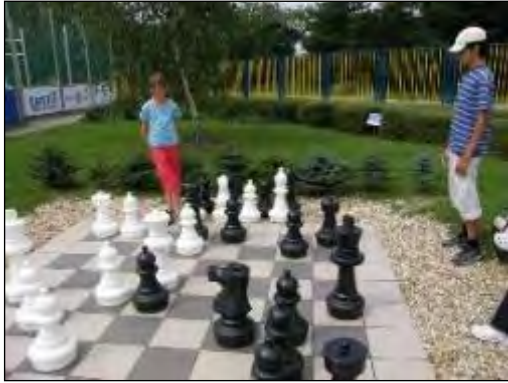
Obr. 57 Exteriérové šachy