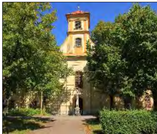
Obr. 12 Kostol Ducha svätého

Južná časť mesta sa začala formovať v období rozvoja obchodu ako prirodzené pokračovanie historického centra. Okolo vlastného územia stredovekých Košíc existovali menšie územné celky – prímestské osady, ktoré sa až do začiatku 16. storočia označovali ako villa, dorff, vicus, dörrfel. Na juhovýchodnom predmestí sa rozprestierala Ludmanova Ves (villa Ludmani, resp. Ludmansdörrfel) i Špitálska ulica; v juhozápadnej časti Bednárska Ves (Bindersdorf, či Bindergass).