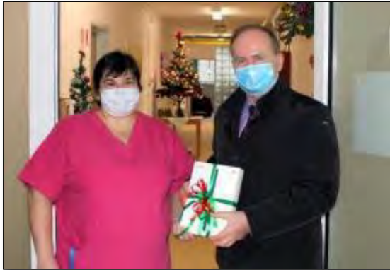
Obr. 2 Odovzdanie tabletu v ZOS