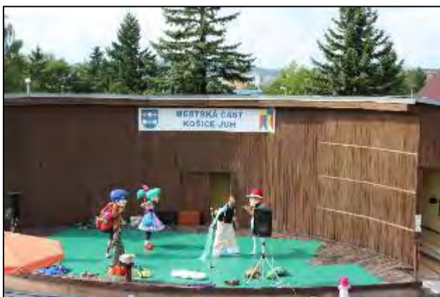
Obr. Alejko a krajina Haravara

Amfiteáter: s kapacitou 500 divákov bol zrekonštruovaný pre organizovanie kultúrno-spoločenských podujatí, sú v ňom vytvorené priaznivé podmienky pre organizovanie koncertov, festivalov, firemných a propagačných akcií, k dispozícii je javisko s ozvučením a zázemím ako šatne, hygienické a sociálne zariadenia pre verejnosť.