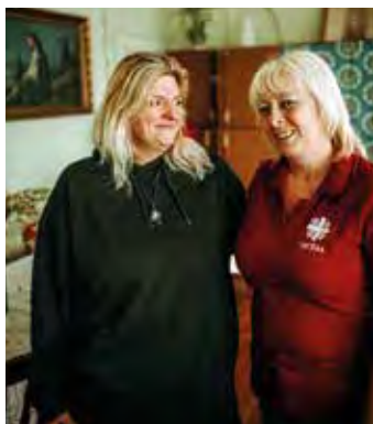
Charitný dom sv. Alžbety na Bosákovej ulici v Košiciach ponúka 2

druhy sociálnych služieb pobyto-ovou formou: útulok a nocľaháreň. Celoročné služby poskytujú dočasný domov, prístrešie, nevyhnutné úkony sociálnej pomoci a odborné poradenstvo. Cieľom sociálnej služby je zlepšenie kvality života ľudí bez vlastného domova a v núdzi. Službami sa snažia znižovať počet ľudí prespávajúcich na ulici a iných verejných priestoroch. Rovnako eliminujú riziká zdravotnej ujmy pre ľudí bez domova. Pod správou Charitného domu sv. Alžbety patrí aj Útulok Emauzy – nocľaháreň na Fialkovej ulici v