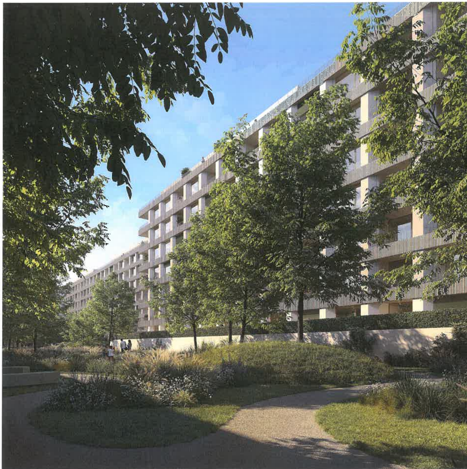
Areálový lineárny park