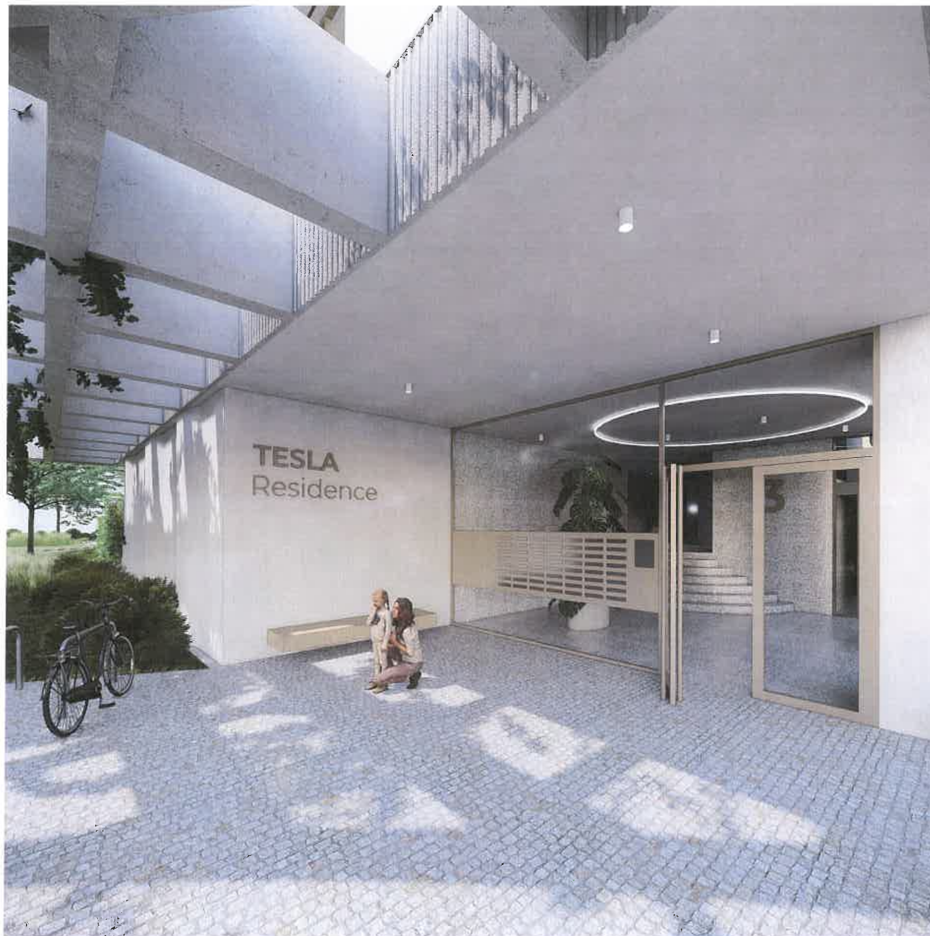
Vstupy do objektov