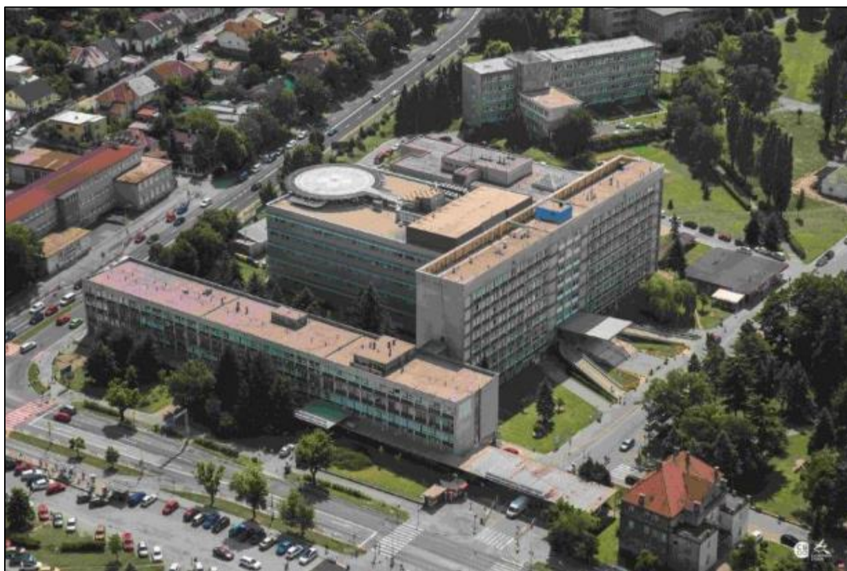
Obr. 27 Univerzitná nemocnica L. Pasteura

Zdravotnú starostlivosť v MČ Košice – Juh poskytuje: Poliklinika Juh Košice, Univerzitná nemocnica L. Pasteura, štátni a súkromní lekári.