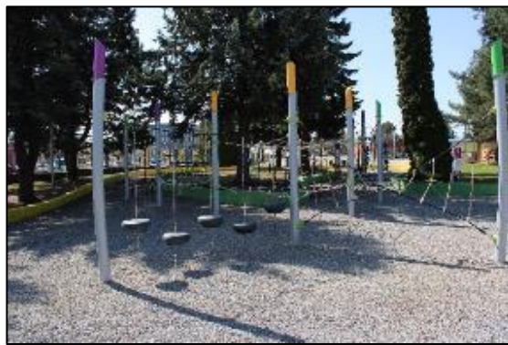
Obr. 71 Opičia lanová dráha