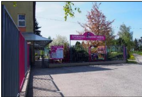
Obr. 67 Vstupná brána ŠZA

Budova areálu: v priestoroch budovy je návštevníkom k dispozícii bufet, detské hry, stolný futbal, tenis, mobilná knižnica a vonku letná terasa, na prvom poschodí sa pravidelne koná dopravná výchova pre deti spojená s premietaním po skončení dopravnej výchovy vedenej príslušníkmi polície. Budova sa dá prenajať k rôznym spoločenským podujatiam ako napríklad oslavy narodenín, detské tematické párty a podobne. Od roku 2016 si môžu návštevníci areálu zahrať v budove areálu billiard, air hockey, stolný futbal a šípky.