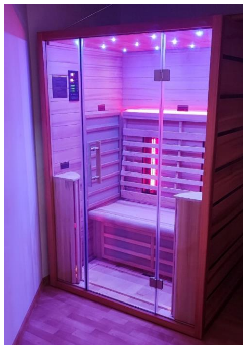
Obr. 56 Infrasauna

V roku 2023 pribudla k novinkám v rámci poskytovania služieb infrasauna.