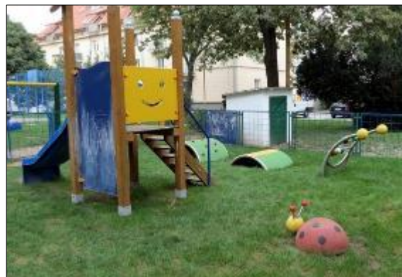
Obr. 48 Detské ihrisko Gaštanová