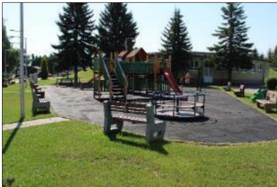
Obr. 58 Pôvodné detské ihrisko

V Zmysle zmluvy o spolupráci medzi Mestskou časťou Košice – Juh a Deutsche Telekom Systems Solutions Slovakia s.r.o. sa zmluvné strany dohodli od roku 2020 na zmene názvu areálu na #MAGENTALIFE Športovo - zábavný areál a v roku 2024 na zmene názvu areálu na Športovo – zábavný areál.