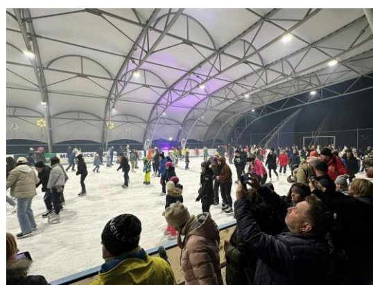
Obr. 63 NON STOP 24 - hodinové korčuľovanie