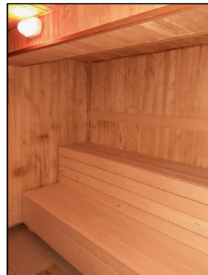
Obr. 54 a 55 Relaxačný bazén s vírivkami a sauna