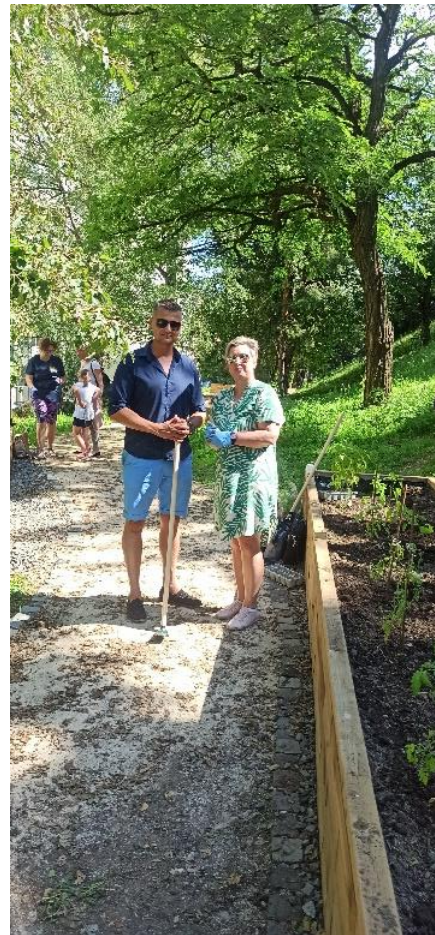
Obr. 10 a 11 Workshop Komunitná záhrada Turgenevova