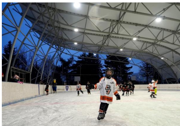
Obr. 62 Korčuľovanie s Alejkom

Ľadová plocha: v decembri 2006 bola sprístupnená verejnosti umelá ľadová plocha o rozmeroch 20x40 m s umelým chladením a osvetlením. Je vybavená profesionálnymi mantinelmi, hokejovými brámkami, ochrannými sieťami a striedačkami, plochu je možné využívať od novembra do marca za predpokladu denných teplôt do +12 st. Celzia, využíva sa na verejné korčuľovanie, amatérsky hokej, tréningovú činnosť hokejových tried ako aj na športovo-zábavné akcie pre obyvateľov mesta Košice. V roku 2014 sme pre najmenších korčuliarov zabezpečili pomôcku na ľad – 2 tučniakov a 2 pandy, ktoré sú nápomocné deťom pri prvých krokoch na ľade. V lete je možné priestor ľadovej plochy využiť aj pre iné športové aktivity ako tenis, speedminton, streetbal, florbal alebo amatérsky hokejbal. V roku 2016 sa ľadová plocha stala po prvýkrát dejiskom Nonstop 24 hodinového korčuľovania, ktoré je spojené so zápisom do knihy Slovenských rekordov. Získali sme 2 slovenské rekordy v počte korčuliarov na ľade počas 24 hodín (1610 korčuliarov) a v počte nakorčuľovaných kilometrov počas 24 hodín (1298 km). V decembri 2016 sme vlastný rekord v počte korčuliarov na ľade prekonal (6043 km). Tento rekord je zapísaný aj v americkej knihe rekordov Record Setter. V roku 2019 sme rekord v počte nakorčuľovaných kilometrov prekonal a jeho výsledná hodnota je 8 986 km. Na úpravu ľadovej plochy sme vďaka finančným prostriedkom z mesta Košice mohli zakúpiť rolbu, vďaka ktorej je kvalita ľadu omnoho vyššia.