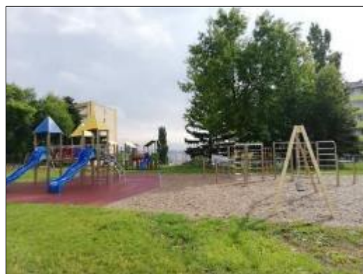
Obr. 44 Detské ihrisko Železníček-Nezbedníček Obr. 45 Detské ihrisko Lomonosovova