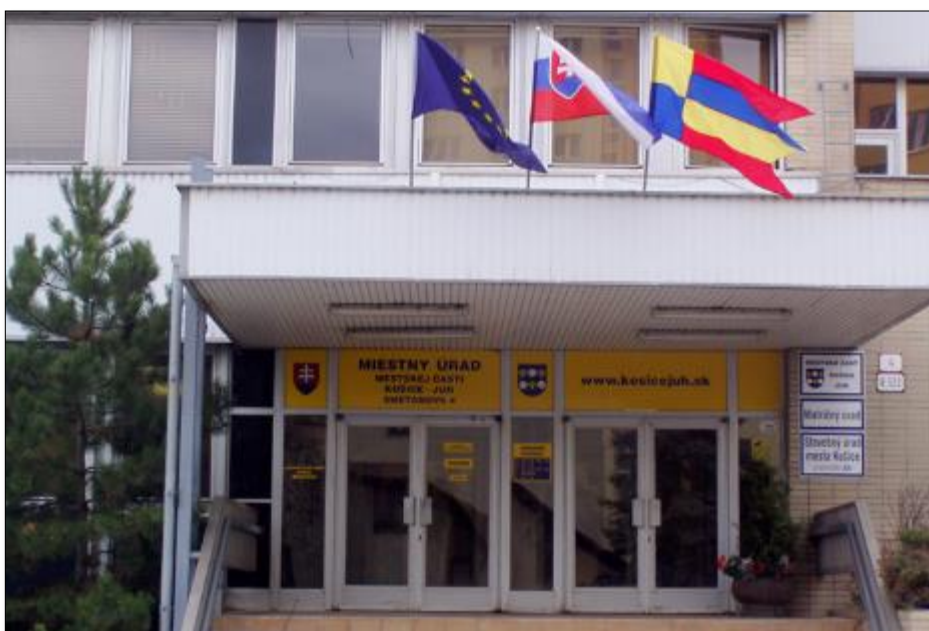
Obr. 16 Vstup do budovy MÚ MČ Košice – Juh, Smetanova 4

Obecný úrad: Miestny úrad MČ Košice - Juh, Smetanova 4, 040 79 Košice