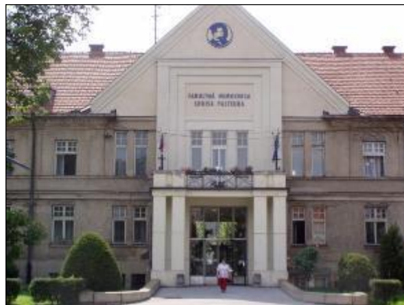
Obr. 23 Univerzitná nemocnica Louisa Pasteura

Francúzsky park je zvláštnosťou Univerzitnej nemocnice Louisa Pasteura na Rastislavovej ul. od jej založenia od r. 1924. Vyše 90 – ročná záhrada UNLP patrí k územiám s najvyšším stupňom ekologickej stability, je označovaná za pľúca Košíc a vytvára mikroklimu južnej časti mesta. Historický park UNLP Košice je posledný nemocničný udržiavaný starý francúzsky park na Slovensku.