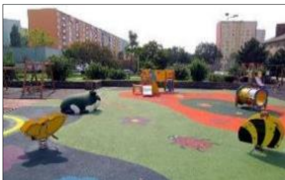
Obr. 46 Detské ihrisko Lienka