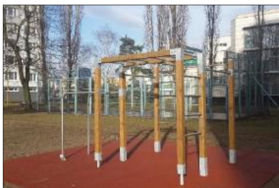
Obr. 50 Fitness ihrisko Paláriková