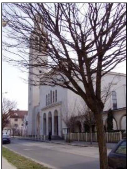
Obr. 20 Kostol Kráľovnej pokoja

Najstaršou známou stavbou na území terajšej mestskej časti je mestský špitál (hospitale, xenodochium) s kostolíkom sv. Ducha na Južnej triede, postavený v polovici 13. storočia. Barokový kostol, ktorý dnes tvorí centrum areálu pre seniorov, postavili v rokoch 1730 - 1733. Obraz hlavného oltára kostolíka s námetom zoslania sv. Ducha je od J. Mathausera a pochádza z roku 1894. Ďalším kostolom v tejto mestskej časti je rímskokatolícky kostol Kráľovnej pokoja, postavený v rokoch 1938 - 1939. Veža kostola je vysoká 32 metrov. Na Rastislavovej ulici sa nachádza Verejný cintorín. Oproti špitálu stál hostinec „U zeleného stromu“, ktorý sa spomína aj v súvislosti s košickou návštevou cisára Jozefa II. v roku 1770.