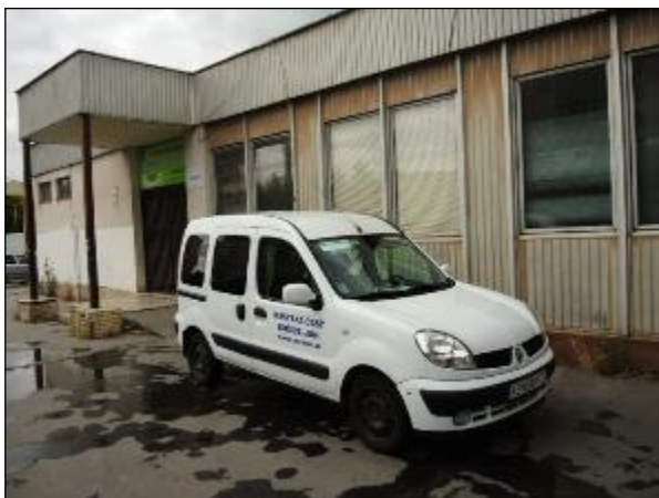
Obr. 33 Jedáleň pre dôchodcov, Vojvodská 5 pôvodný stav