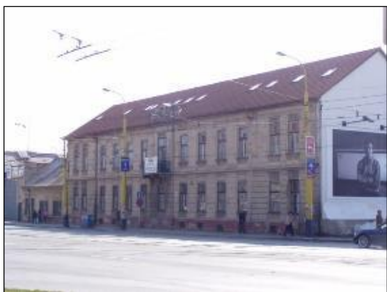
Obr. 18 Siposova továrň