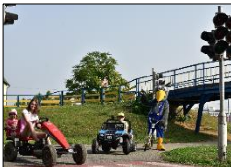
Obr. 60 a 61 Dopravné ihrisko

Ľadová plocha: v decembri 2006 bola sprístupnená verejnosti umelá ľadová plocha o rozmeroch 20x40 m s umelým chladením a osvetlením. Je vybavená profesionálnymi mantinelmi, hokejovými brámkami, ochrannými sieťami a striedačkami, plochu je možné využívať od novembra do marca za predpokladu denných teplôt do +12 st. Celzia, využíva sa na verejné korčuľovanie, amatérsky hokej, tréningovú činnosť hokejových tried ako aj na športovo-zábavné akcie pre obyvateľov mesta Košice. V roku 2014 sme pre najmenších korčuliarov zabezpečili pomôcku na ľad – 2 tučniakov a 2 pandy, ktoré sú nápomocné deťom pri prvých krokoch na ľade. V lete je možné priestor ľadovej plochy využiť aj pre iné športové aktivity ako tenis, speedminton, streetbal, florbal alebo amatérsky hokejbal. V roku 2016 sa ľadová plocha stala po prvýkrát dejiskom Nonstop 24 hodinového korčuľovania, ktoré je spojené so zápisom do knihy Slovenských rekordov. Získali sme 2 slovenské rekordy v počte korčuliarov na ľade počas 24 hodín (1610 korčuliarov) a v počte nakorčuľovaných kilometrov počas 24 hodín (1298 km). V decembri 2016 sme vlastný rekord v počte korčuliarov na ľade prekonal (6043 km). Tento rekord je zapísaný aj v americkej knihe rekordov Record Setter. V roku 2019 sme rekord v počte nakorčuľovaných kilometrov prekonal a jeho výsledná hodnota je 8 986 km. Na úpravu ľadovej plochy sme vďaka finančným prostriedkom z mesta Košice mohli zakúpiť rolbu, vďaka ktorej je kvalita ľadu omnoho vyššia.