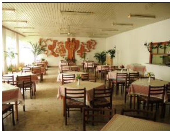
Obr. 34 Interiér Jedálne pre Dôchodcov pôvodný stav