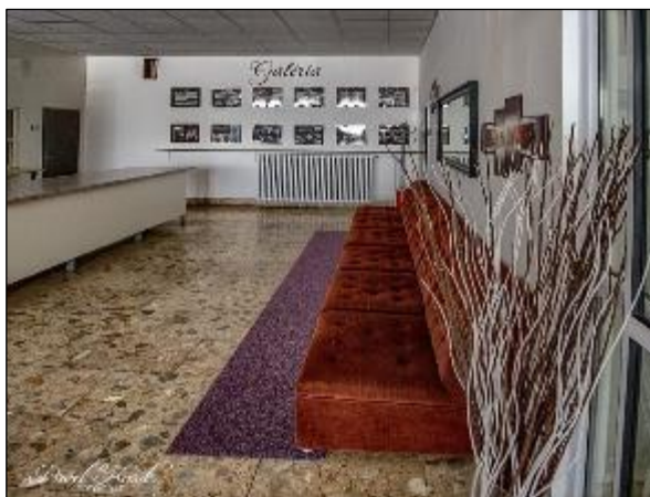
Obr. 37 a 38 Interiér Jedálne pre dôchodcov, Vojvodská 5 po úpravách v roku 2019 a 2020