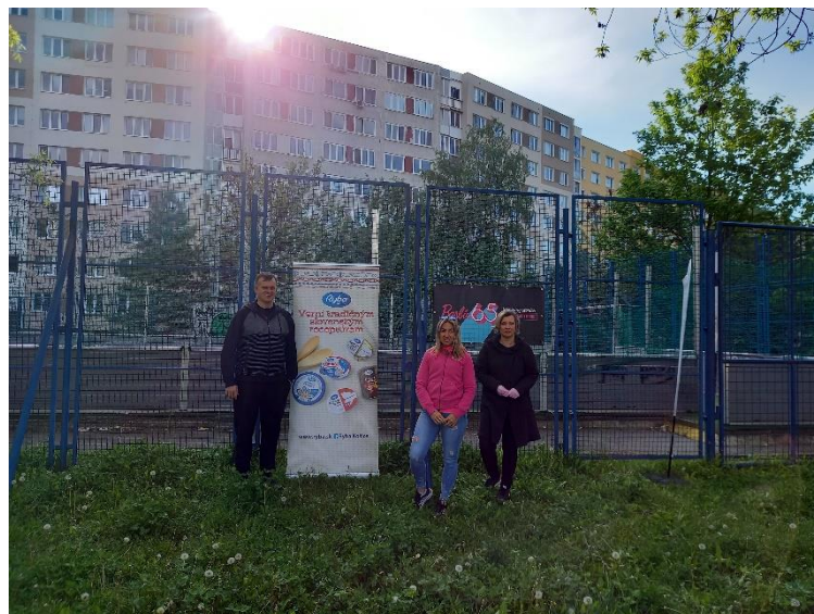
Obr. 12 Barbie upraruje Slovenko