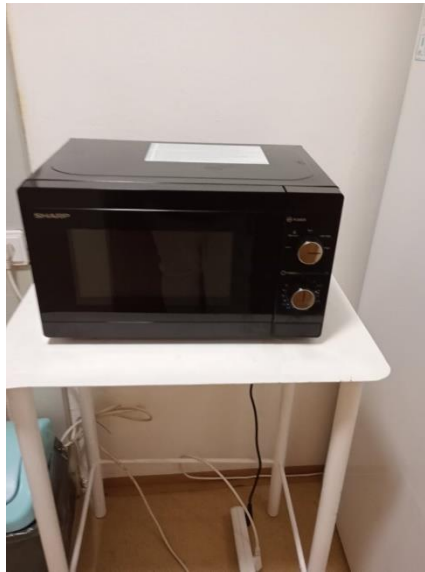
Obr. 30 a 31 Nové vozíky na rozvoz stravy, prádla pre klientov, nová mikrovlnná rúra

Terénna opatrovateľská služba – sa poskytuje na základe Štatútu mesta Košice z úrovne Mestskej časti Košice – Juh pre 6 mestských častí – Juh, Nad jazerom, Barca, Šebastovce, Vyšné Opátske a Krásna. V rámci opatrovateľskej služby sa predovšetkým poskytuje sociálna služba osobám, ktoré sú odkázané na pomoc inej fyzickej osoby a jej odkázanosť je v stupni najmenej II. a je odkázaná na pomoc pri úkonoch sebaobsluhy, úkonoch starostlivosti o svoju domácnosť a základných sociálnych aktivitách. Tieto služby sa v roku 2024 celkovo poskytovali pre cca 280 klientov, z toho má „komplexné služby“ 91 klientov a z nich 56 odoberá aj obedy a 181 klientom sa zabezpečuje iba dovoz obedov. MČ Košice Juh zabezpečuje dovoz obedov 3 autami, ktoré sú vybavené izotermickou nadstavbou.