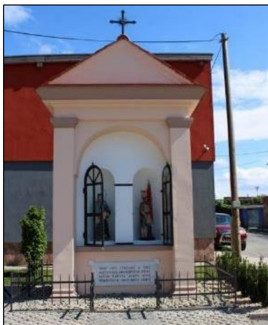
Obr. 25 Božia muka svätého Floriána a svätého Jána Nepomuckého

Božia muka svätého Floriána a svätého Jána Nepomuckého - pre tento typ sakrálnej stavby sa používa termín „božia muka“, od kaplnky sa líši tým, že nemá vnútorný priestor, do ktorého vojde človek. Bola postavená v roku 1826 ako odkaz na kresťanskú tradíciu odpúšťania dlhov a trestov za spáchané hriechy. Je vymurovaná z tehál a kameňa v klasicistickom štýle. V oblúkovite ukončenom výklenku sú vyhlbené dve hlbšie niky. V nich sa pôvodne nachádzali drevené sochy sv. Floriána a sv. Jána Nepomuckého. Svätci vytvárali klasickú zostavu ochrancov proti vode a ohňu.