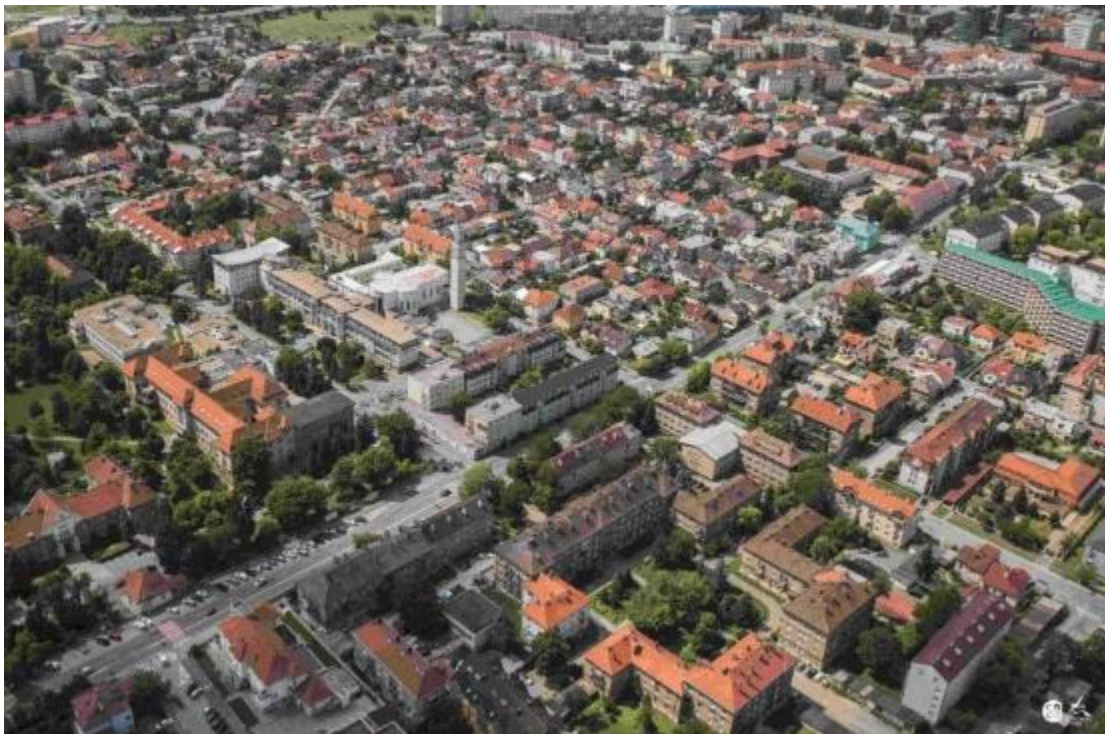
Obr. 17 Pohľad na MČ Košice – Juh z vtácej perspektívy