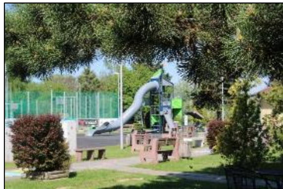
Obr. 59 Nová herná veža s tobogánom

Viacúčelové športové ihriská: v rokoch 2004 až 2006 boli vybudované tri viacúčelové ihriská s umelým trávnatým povrchom a umelým osvetlením s využitím na basketbal, volejbal, nohejbal, futbal či tenis. Ihriská je možné využívať celoročne, sú oplotené a vybavené brámkami, basketbalovými košmi a k dispozícii je aj požičovňa športových náradí a šatne.