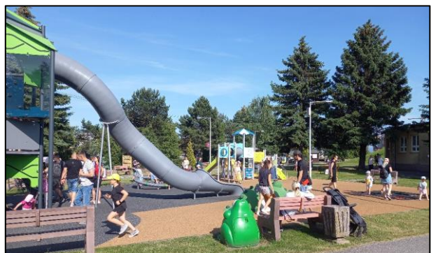
Obr. 69 Detské ihrisko