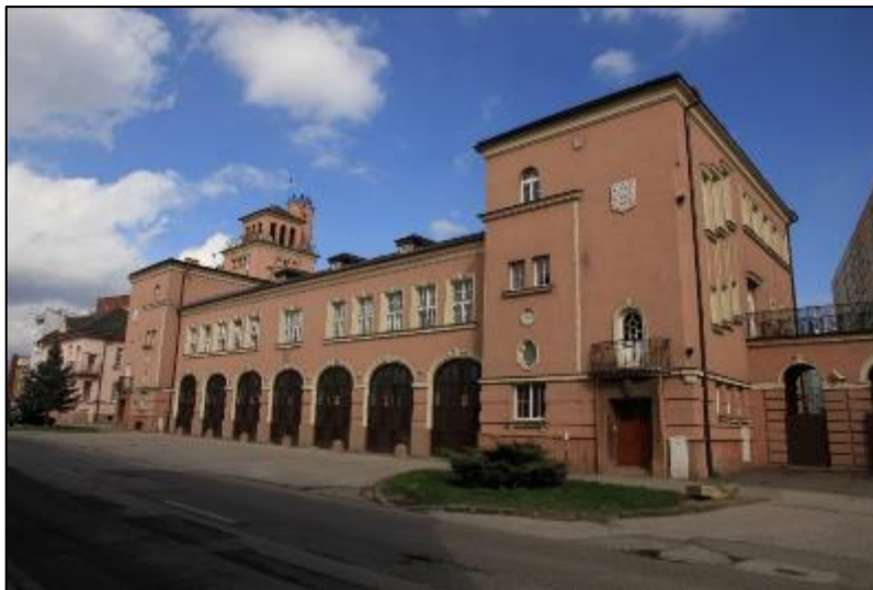
Obr. 21 Budova Okresného riaditeľstva hasičského a záchranného zboru