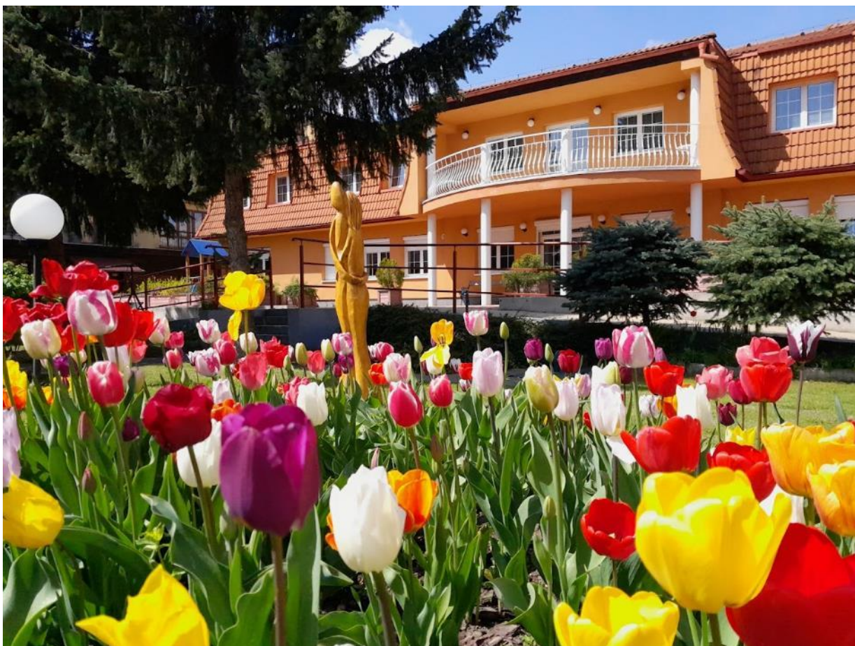
Obr. 52 Budova Spoločensko-relaxačného centra, Milosrdenstva 4

Denné centrum seniorov tak plní požiadavky občanov v oblasti záujmovej, kultúrnej a športovej činnosti, v snahe udržiavania fyzickej a psychickej aktivity občanov, ktorí sú poberateľmi starobného dôchodku alebo občanov s nepriaznivým zdravotným stavom.