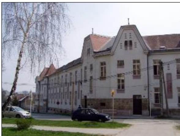
Obr. 22 Budova Strednej zdravotníckej školy

V polovici 19. storočia sa na území súčasnej mestskej časti začal prudko rozvíjať priemysel. Bolo postavených niekoľko tovární a továrničiek, napr. prvý košický cukrovar, Sipossova továreň na pletený tovar, továreň na počítačie a písacie stroje, Strojáreň bratov Szlovenszských, továrne rodiny Ungárovcov, likérka Adler a Gold, továreň na koňak, likéry a rum, košická parná továreň na škrob a lepidlo, továrničky na nábytok, parkety, kávodviny, ale aj chemická čistiareň, pracovňa a továreň na mydlo. Medzi najvýznamnejšie patrila Strojáreň a zlieváreň Karola Poledniaka z prelomu 19. a 20. storočia, ktorej areál bol jedinou technickou historickou pamiatkou v mestskej časti.