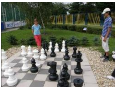
Obr. 68 Exteriérové šachy

Atrakcie areálu: hovoriaca lavička, stroje na cvičenie, 3D maľba draka, exteriérové šachy, ruské kolky, človeče nehnevaj sa, altánok a veľa ďalších skvelých možností trávenia voľného času pre všetky vekové kategórie. Fanúšikovia cvičenia na čerstvom vzduchu radi využívajú cvičenia v exteriérovej posilňovni. V roku 2019 pribudlo niekoľko nových zábavných atrakcií: pre deti sme namaľovali interaktívny skákací chodník, na ktorom si užijú mnoho zábavy. Veľkej obľube sa teší 18 metrová nafukovacia dráha a nafukovací hrad pre malé deti a pre starších návštevníkov aj petangové ihrisko. V závere roka 2020 areál zatriktívnilo nové detské ihrisko, jedinečné svojho druhu na východnom Slovensku. Veža ihriska sa nachádza vo výške 6 metrov a deti sa môžu zhora spustiť na dvoch šmykl'avkách. V roku 2021 sme doplnili areál aj o vodný prvok v podobe aquapaddlera – člnkovanie a o opičiu lanovú dráhu s rôznymi preliezacími prvkami. V roku 2022 pribudol aj šliapací kolotoč a bola dokončená druhá etapa detského ihriska pre deti od troch rokov s trampolínami a 3D zvieratkom - krokodíl.