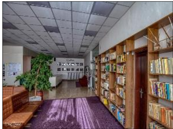
Obr. 39 a 40 Interiér Jedálne pre dôchodcov, Vojvodská 5 po úpravách v roku 2019 a 2020

Denné centrum v budove Spoločensko-relaxačného centra, Milosrdenstva 4, Košice ako sociálna služba pre seniorov, zdravotne postihnutým občanom, poskytuje sociálne poradenstvo a zabezpečuje záujmovú činnosť pre svojich členov (cca 320), tak plní požiadavky občanov v oblasti záujmovej, kultúrnej a športovej činnosti, v snahe udržiavania fyzickej a psychickej aktivity občanov, ktorí sú poberateľmi starobného dôchodku alebo občanov s nepriaznivým zdravotným stavom. Činnosti denného centra v oblasti záujmovej zabezpečuje oddelenie kultúry, mládeže a športu, činnosť v oblasti sociálneho poradenstva je v gescii oddelenia sociálnych vecí MČ Košice-Juh.