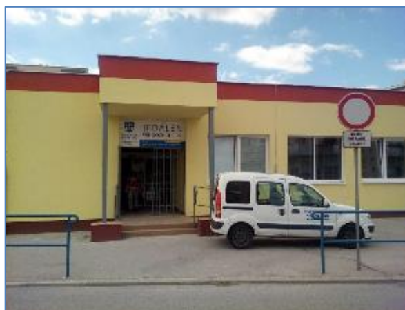
Obr. 35 a 36 Jedáleň pre dôchodcov, Vojvodská 5 po rekonštrukcii v roku 2016

Počet predaných stravných lístkov v roku 2024 s priznaným účelovým finančným príspevkom mesta Košice na stravovanie dôchodcov bol 50976 ks a celková suma účelového finančného príspevku mesta Košice na stravovanie dôchodcov za rok 2024 činila pre dôchodcov MČ Košice – Juh sumu 101952 eur.